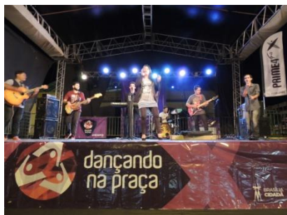
19 - DANÇANDO NA PRAÇA – EDIÇÃO ARRAIÁ - Taguaparque - Taguatinga - 16/11/2017 - Realização com estrutura completa e equipe.