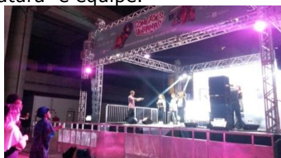
21 - 20º PORÃO DO ROCK - Estádio Mané Garrincha - Brasília - DF - 25/11/2017 - Apoio com estrutura e equipe.