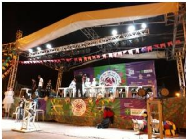
20 - X LATINIDADES - FESTIVAL DA MULHER AFRO LATINO AMERICANA E CARIBENHA - Estadio Nacional Mané Garrincha - 25/11/2017 - Apoio com estrutura e equipe.