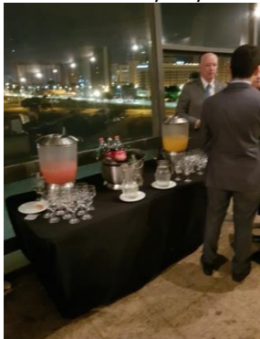
16 - 70 ANOS DA COPA AIRLINES E 6 ANOS DA ROTA BRASÍLIA / CIDADE DO PANAMÁ - Mezanino da Torre de TV - Brasília - DF - 31/08/2017 - Apoio com coquetel, ambientação e equipe.