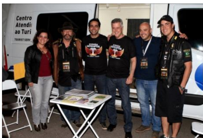
14 - C.O.M.A - CONVENÇÃO DE MÚSICA E ARTE - Clube do Choro - Gramado da Funarte - Brasília - DF - Apoio com estrutura e equipe.